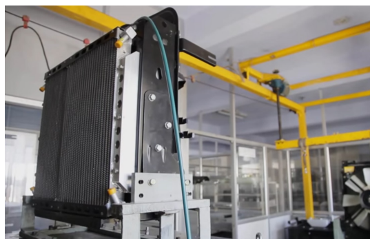
Testes de vibração para simular as condições reais de operação e na estrada.

Os radiadores e os intercoolers Euro VI exigem um maior nível de rendimento devido a uma maior pressão