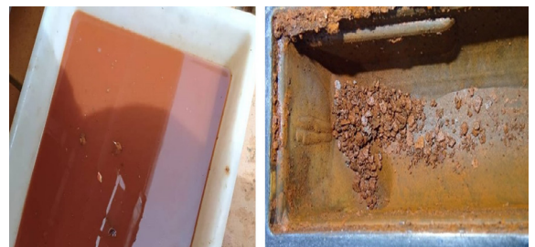
Foto 4 y 5. Muestra de agua del grifo utilizada como refrigerante y corrosión del motor.

A simple vista, el refrigerante en el tanque de expansión se vuelve marrón oxidado. A medida que pasa el tiempo, este óxido se convierte en corrosión, lo que sedimenta más, y arranca unas escamas metálicas de los elementos más dañados, que atascan los tubos del radiador, obligándolo a trabajar con sobrepresión y, finalmente, haciendo que gotee por atasco.