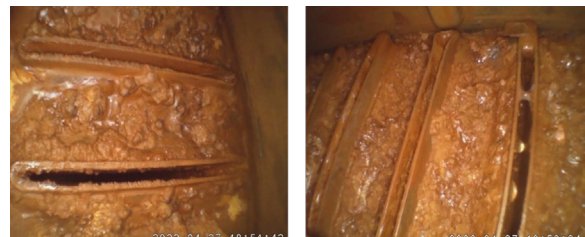
Foto 2. y 3. Sedimentos de óxido dentro de los tubos del radiador.

> Agua de grifo: El agua del grifo tiene en disolución una gran cantidad de sustancias, algunas de ellas son compuestos iónicos (sales) que, en disolución y a altas temperaturas, pueden ser corrosivas para los metales ferrosos de los que está hecho el motor. La acción continuada de esas sustancias oxida progresivamente el metal del motor, formando sedimentos de óxido.