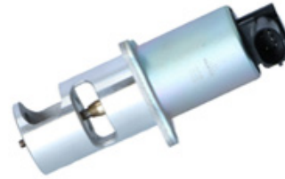
Ejemplo de válvula EGR (NRF 48323)

El nivel de contaminación se puede determinar, entre otros, en la base de la válvula EGR reemplazada (ver ejemplos - debe ser una indicación para un mecánico).