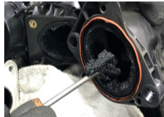
Permeabilidad del sistema limitada por una contaminación con carbonilla excesiva.

Después de limpiar el sistema, sustituir la válvula por una nueva. Después del montaje, no debe haber códigos de error.