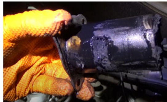
Válvula original desmontada del vehículo