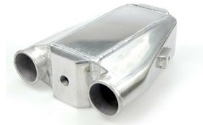
Universal liquid-cooled intercooler

delantera del vehículo y dependen menos de la temperatura exterior que los intercoolers enfriados por aire. Utilizan un circuito por el que circula refrigerante, que absorbe el exceso de calor del aire de carga. Son ampliamente utilizados en camiones, vehículos de carreras y de alto rendimiento.